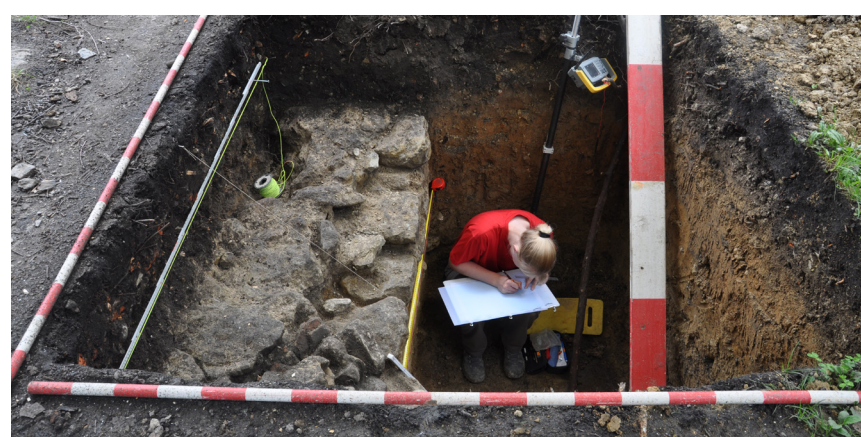
In mehreren Schnitten konnte die im Boden erhaltene Innenbebauung dokumentiert werden.