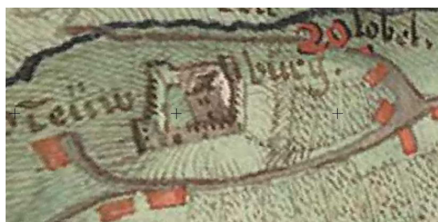
Der Ausschnitt aus der Gyger-Karte von 1662/63 zeigt ein Idealbild der ursprünglichen «Neuwbürg».

Staatsarchiv Zürich, CH-000033-9PLAN_N_166.