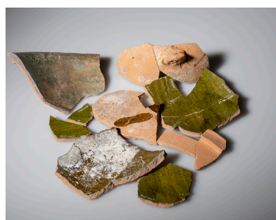
Diese grün glasierten Gefässe wurden von den Bewohnerinnen und Bewohnern der Burg genutzt.