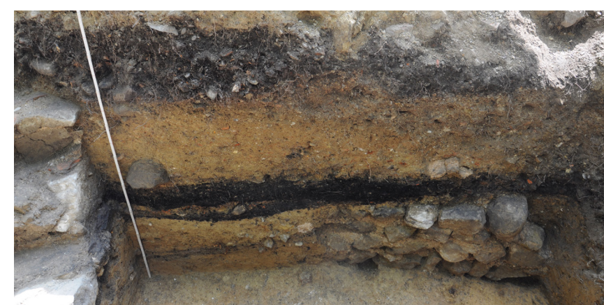
Profilschnitt eines Schnitts im Osten der Burganlage. Die etwa 20cm dicke Holzkohleschicht ist wohl auf die Zerstörung durch die Appenzeller 1405–1407 zurückzuführen.