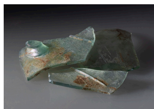
Glasfragmente eines Nuppenbeckers aus dem 13./14. Jahrhundert.