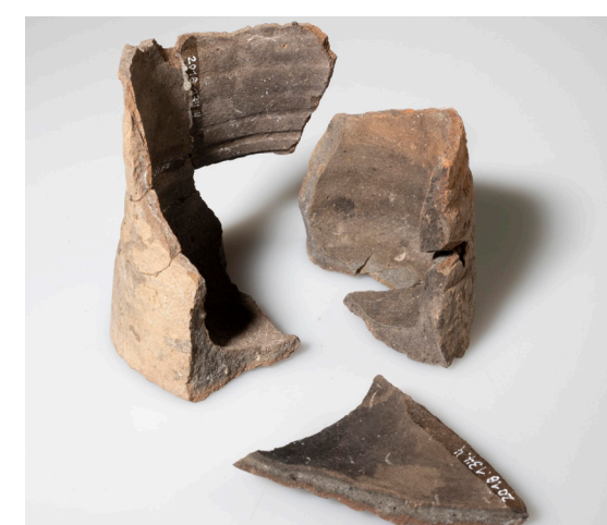
Einzelne Räume in der Burg waren beheizt wie Bruchstücke von Ofenkacheln belegen.

Amt für Archäologie des Kantons Thurgau Schlossmühlestrasse 15, 8510 Frauenfeld