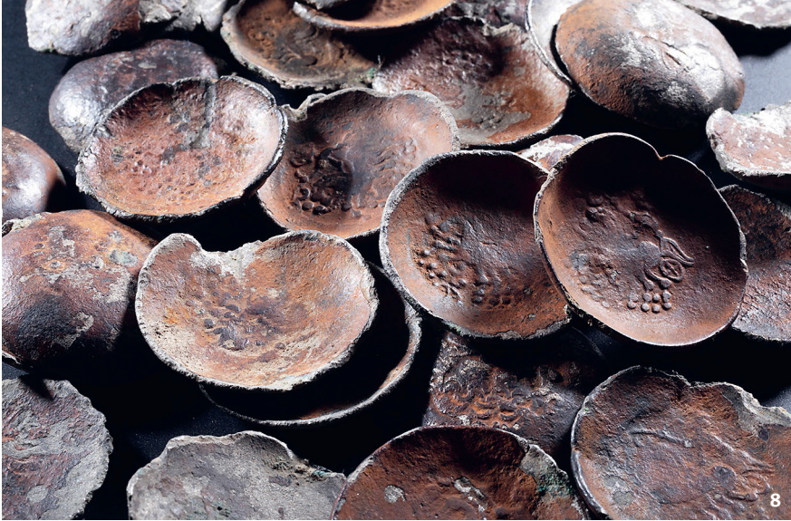
Abb. 8 Der Münzschatz von Tägerwilen, über 50 sog. «helvetische Silberstater» aus der Zeit um 100–50 v.Chr.

Le trésor monétaire de Tägerwilen contient plus de 50 statères helvètes en argent datés entre 100 et 50 av. J.-C.