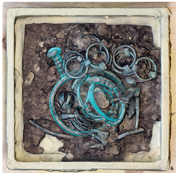
Immagine 3D elaborata dalle riprese di fotogrammetria del tesoretto di oggetti in bronzo di Wagenhausen-Etzwilen.

wurden aber eine Grube oder andere Strukturen von der Niederlegung der Bronzegegenstände festgestellt. Das Depot umfasst unter anderem zwei Schmucknadeln. Dazu kommen mehrere Arm- oder Fussringe, darunter ein Exemplar mit Fischgrätemuster, ein Gürtelgehänge sowie eine Pfeilspitze. Aufgrund der typischen Schmucknadeln, sog. Binningernadeln, kann der Fund in die Spätbronzezeit um 1200 v.Chr. datiert werden. Weder im Block noch bei der Nachgrabung sind kalzinierte Knochen oder aschehaltige Schichten zum Vorschein gekommen, deshalb dürfte es sich nicht um Grabbeigaben handeln. Wahrscheinlicher ist, dass die Bronzeobjekte deponiert worden sind, ob als sakrale Weihgabe oder versteckter Materialhort bleibt offen.