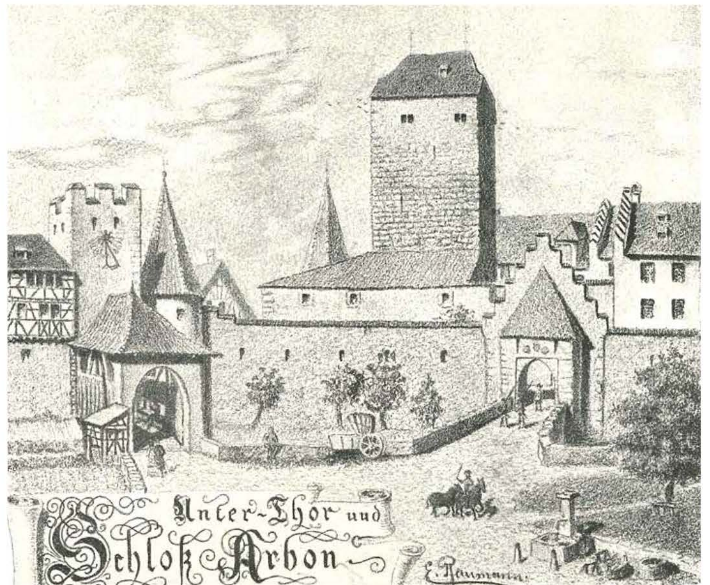
Das Untertor und das Schloss auf einer undatierten Zeichnung zeigt einen Zustand wie er vor 1834 bestand.